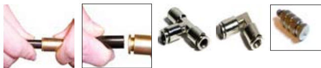
Schnellverbindungsteile bis 120 Bar Druckbereich